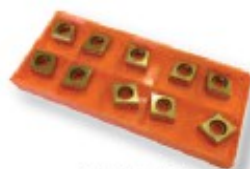
Obj. č. 27231