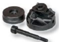
Obj. č. 27234