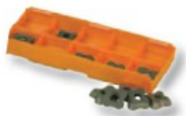
Obj. č. 26109