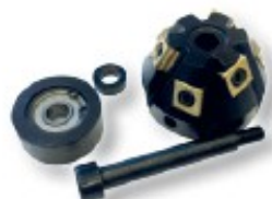
Obj. č. 27223