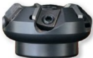
Obj. č. 28221