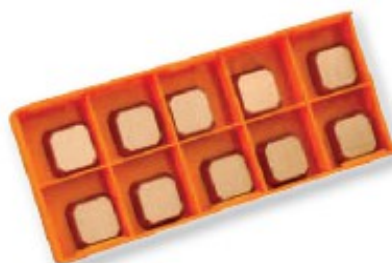
Obj. č. 25909