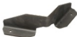
Pravítko pro trubky